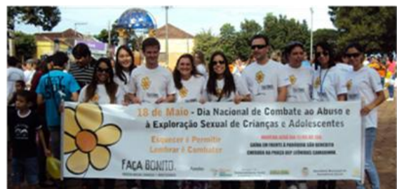
Combate à Exploração Sexual de Crianças e Adolescentes