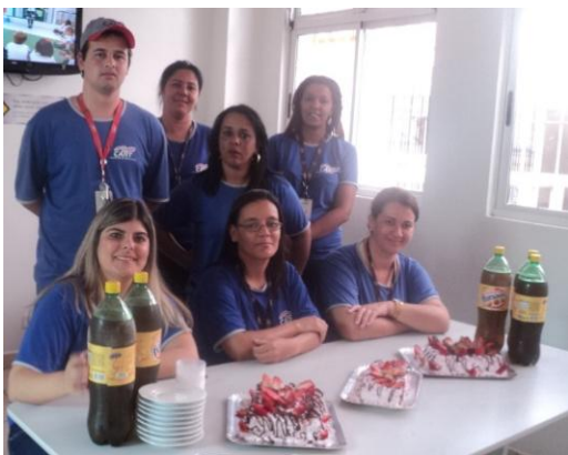
Aniversariantes do Mês