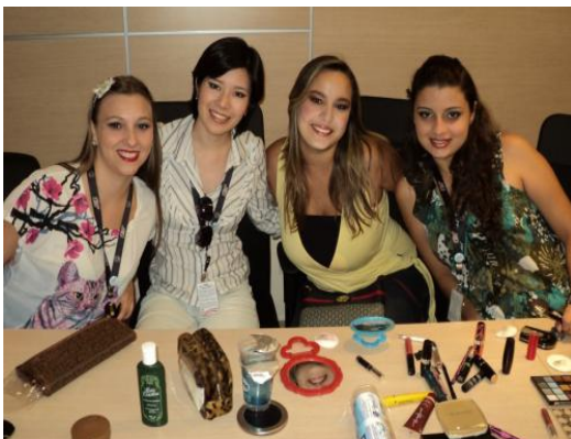
Dia da Mulher