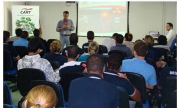
Palestra – Segurança Viária