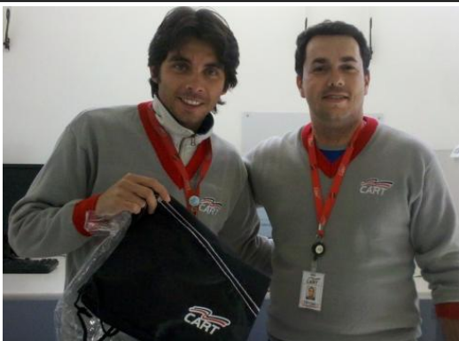
Dia dos Pais