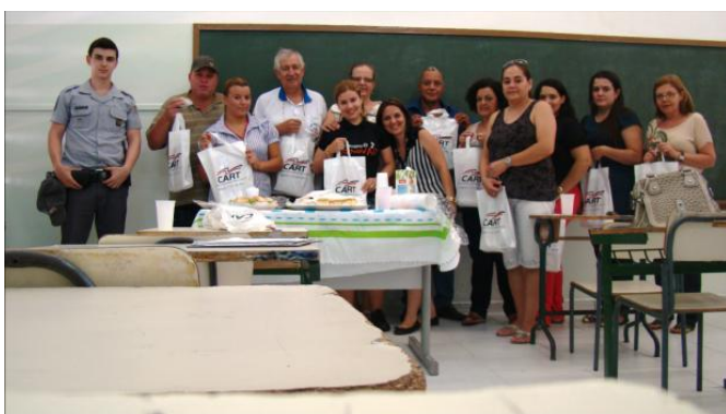
Café com ideia na comunidade