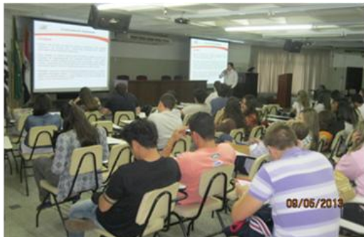
Palestra – Meio Ambiente

O Relatório Anual de 2012 da Invepar foi produzido de acordo com a metodologia GRI (Global Reporting Initiative), uma das mais utilizadas e reconhecidas em todo o mundo, que contribui para a adoção da prática de medir, divulgar e prestar contas para stakeholders do desempenho organizacional, tendo como objetivo final promover o desenvolvimento sustentável. A CART participou deste processo de elaboração do relatório e mensuração de indicadores de sustentabilidade.