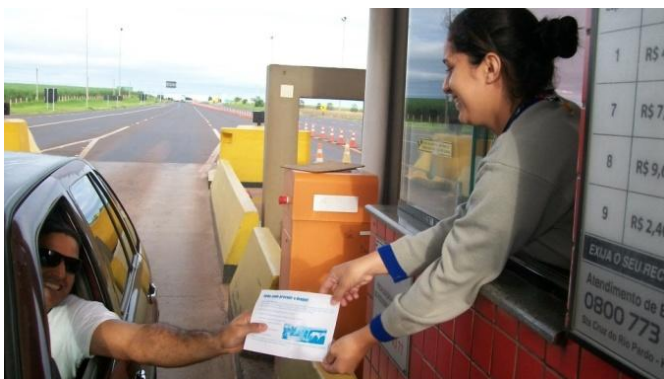
Campanhas com usuários da rodovia