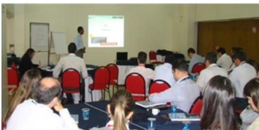
Workshop da Responsabilidade Socioambiental